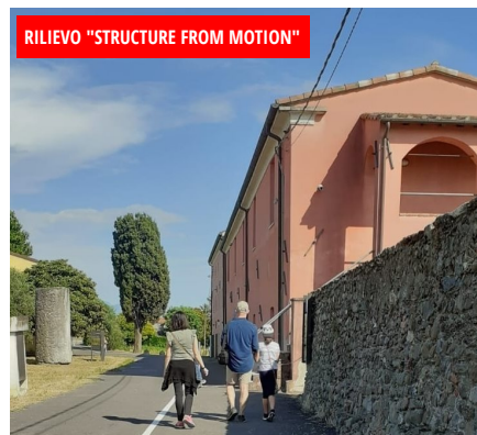
RILIEVO "STRUCTURE FROM MOTION"

Intervento che ha coinvolto il Dipartimento di ingegneria civile per l'applicazione di tecniche e tecnologie avanzate.