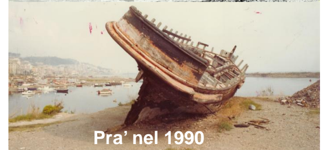
Pra' nel 1990