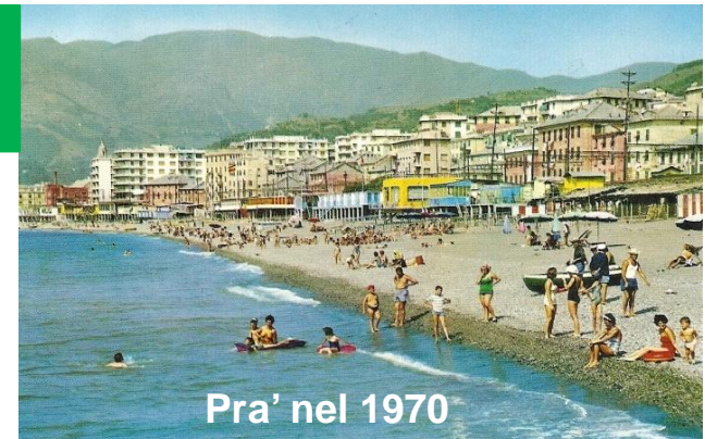
Pra' nel 1970